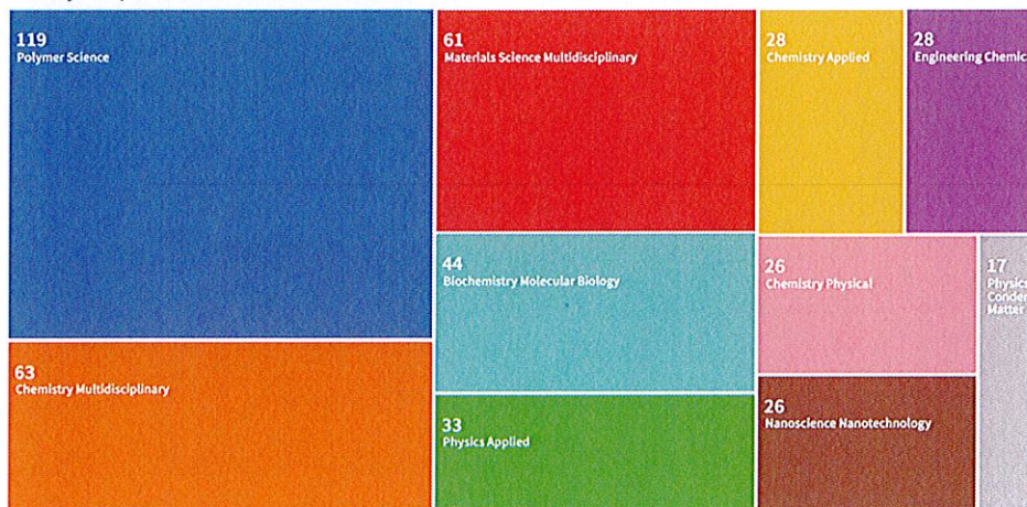
Obrázek č. 1 Analýza Jimp publikací školitelů daného studijního oboru dle WoS (2019-2022).

Pokud ve WoS položíme dotaz na výsledky UTB ve sledovaném období, typ dokumentu „article“ a současně omezíme autory pouze na školitele daného studijního oboru, získáme oborové rozdělení daných publikací dle Obrázku č. 1.